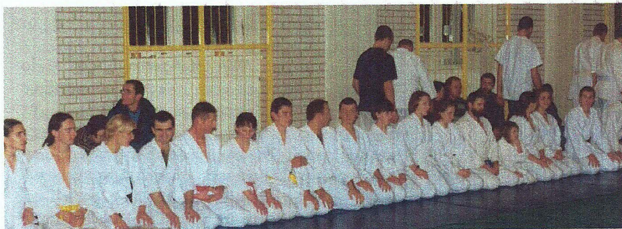
Staż Lokalny - listopad 2001