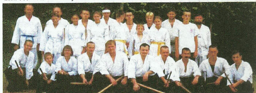
Uczestnicy Letniego Obozu Aikido - Alton Rytro 1999