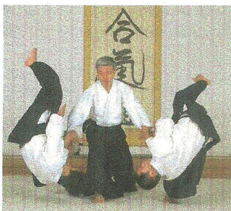
Obecny Doshu Aikido wnuk O-Senseia, Moriteru Ueshiba