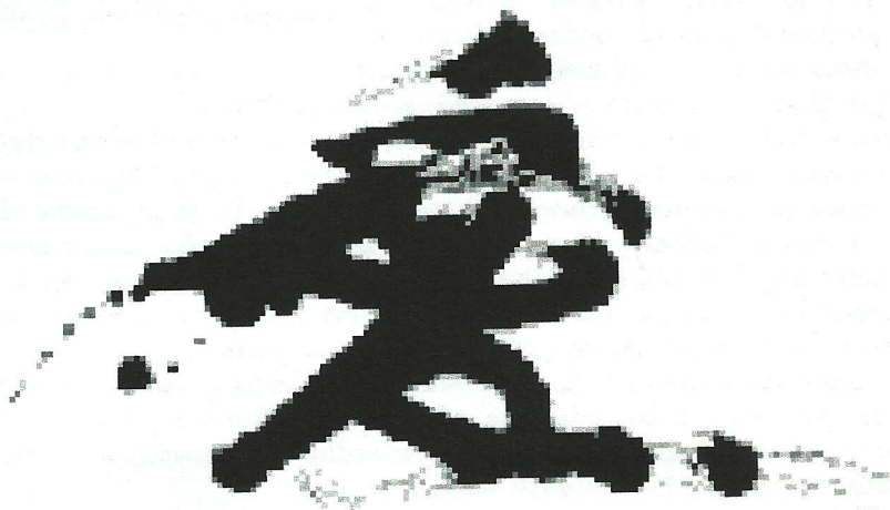
Kaligrafia O`Sensei Morihei Ueshiba „Ai”

Prawdziwym powodem istnienia aikido w dzisiejszym świecie jest jego identyfikowanie się z ideałami Mistrza Ueshiba, nawet gdy większość społeczeństwa uważa je tylko za jeszcze jedną formę sztuki walki, opartą na współzawodnictwie.