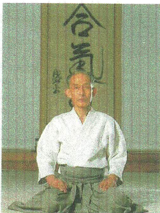
Doshu Aikido Kisshomaru Ueshiba (1921 - 1999)

Powyższe słowa nie mają na celu krytyki innych sztuk walki za to, że się stają współczesnymi konkurencjami sportowymi. Z historycznego punktu widzenia taki kierunek rozwoju był nieunikniony dla ich przetrwania, zwłaszcza w Japonii po II