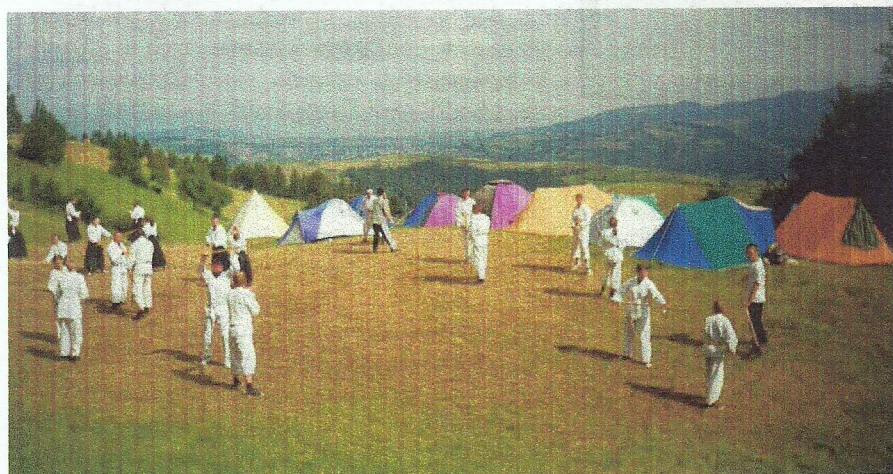
Letni Obóz Aikido - Alton Rytro 1999